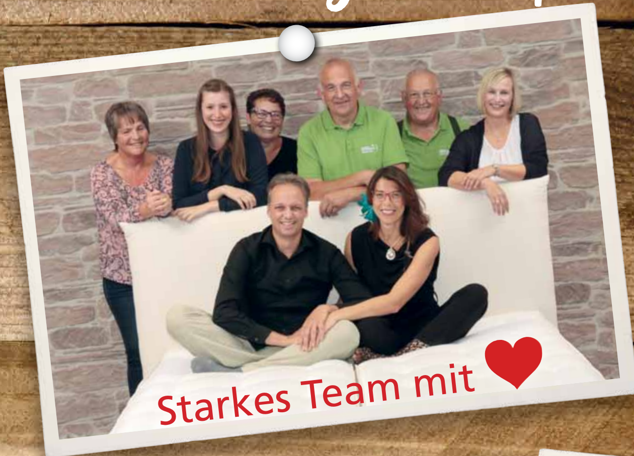
Starkes Team mit ❤️

Perfekter Service wird bei uns groß geschrieben! Wir sind für Sie da und geben täglich unser Bestes damit Sie gut schlafen. Gerade in der momentanen Situation finden Sie bei uns im regionalen Fachgeschäft einen Platz, an dem Sie sich bei Ihrem Einkauf und danach rundum wohl fühlen!