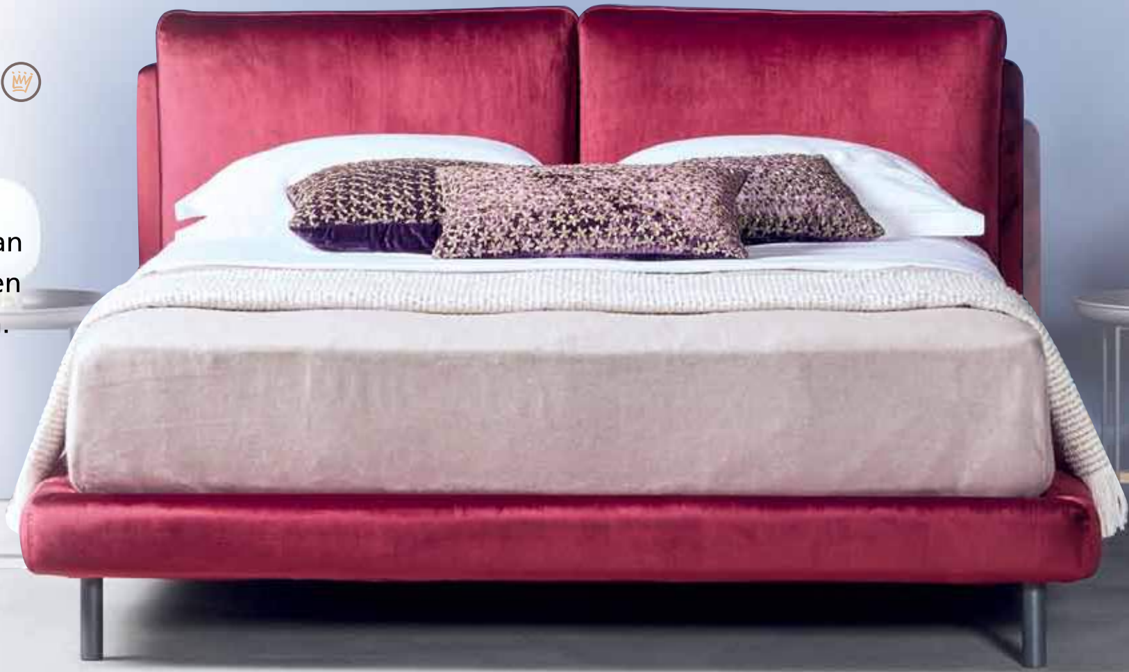
SCHRAMM ORIGIN Complete Ono Boxspring in herrlich bequemer Ausführung Designed by Sebastian Herkner 180/200 cm ab 4775,- (ohne Matratzen und Dekoration)

Die handgefertigten Boxspring-Betten von Schramm bieten ihnen diesen traumhaften Luxus – aber ist höchster Schlafkomfort wirklich ein Luxus?